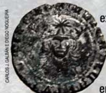
Moneda del s. XV encontrada en Vimianzo Pièce du XV s trouvée à Vimianzo

De la forteresse au manoir. Une fois le château ast cessé d'être la scène de batailles, une partie résidentielle est construite à l'intérieur, dans un style proche aux "pazos".